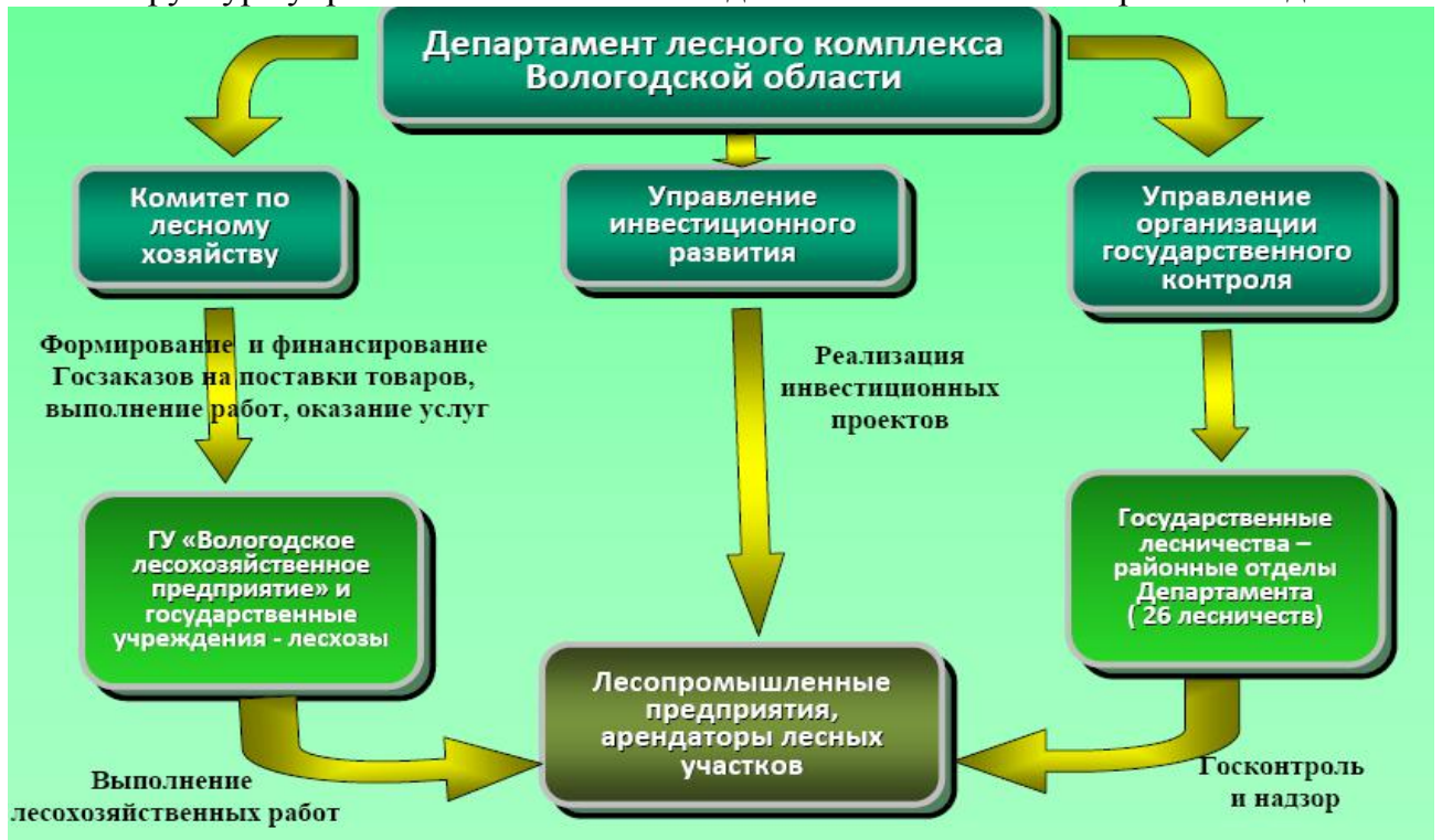
Рис.3 Структура управления лесами Вологодской области на 1 января 2008 года

В соответствии с приказами Рослесхоза от 4 июля 2007 года №329 и от 7 декабря 2007 г. №491, в лесах, находящихся в ведении Департамента лесного комплекса Вологодской области, в границах административных районов организовано 26 лесничеств.