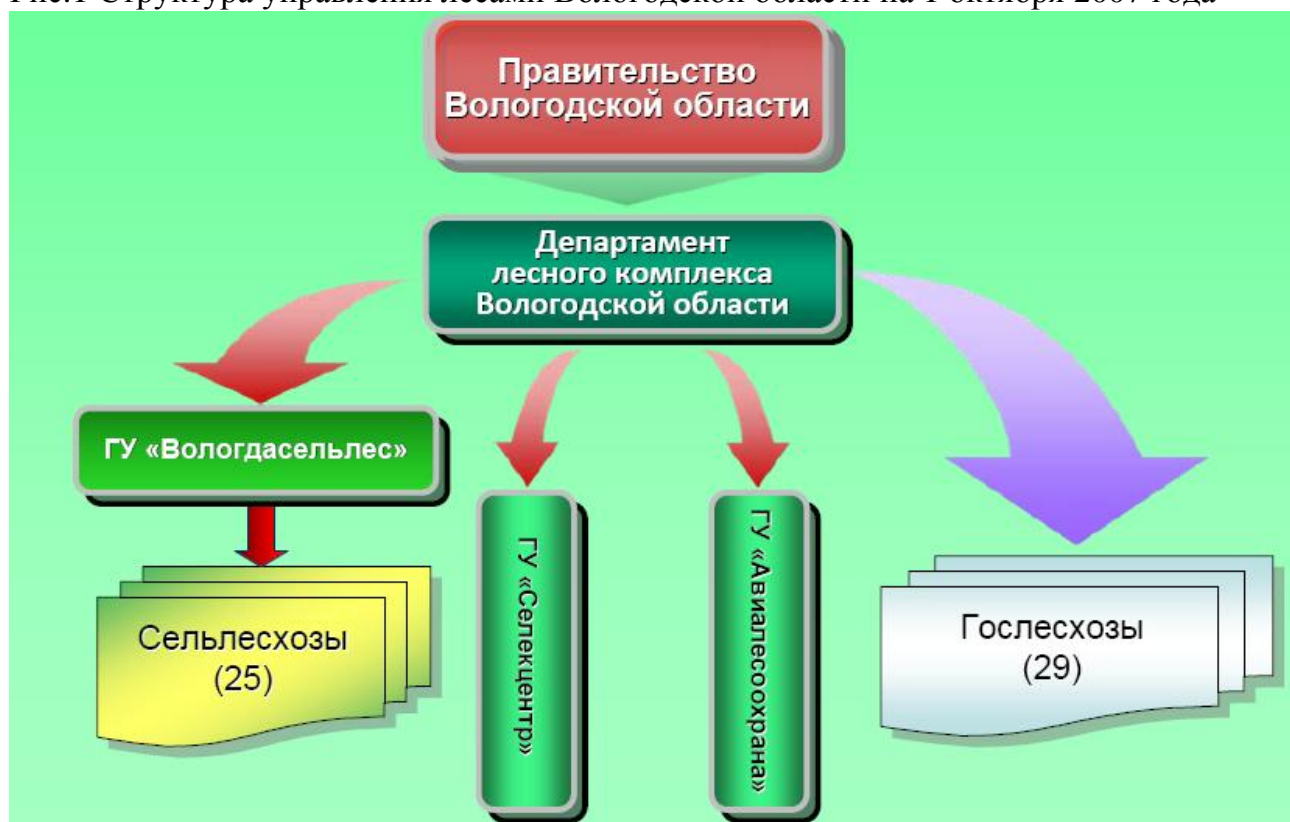
Рис.1 Структура управления лесами Вологодской области на 1 октября 2007 года

лесов, их социально-экономическое значение, количественные и качественные целевые прогнозные показатели использования лесов, указываются мероприятия и зоны освоения лесов, планируется воспроизводство и охрана лесов, обосновывается структура регионального управления лесами. То есть в этом документе оговариваются объемы мероприятий по управлению лесами на перспективу до десяти лет. Этот специфический документ очень важен для субъекта Федерации и в части экономики тоже, потому что на основании объемов, заложенных в нем, будет определяться размер федеральных субвенций для финансирования лесного хозяйства и осуществления переданных области полномочий.